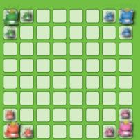
Pour 4 joueurs