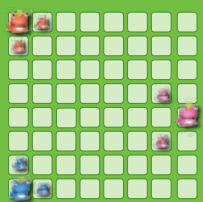
Pour 3 joueurs